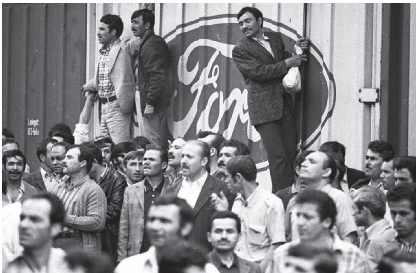
Streik bei Ford in Köln 1973